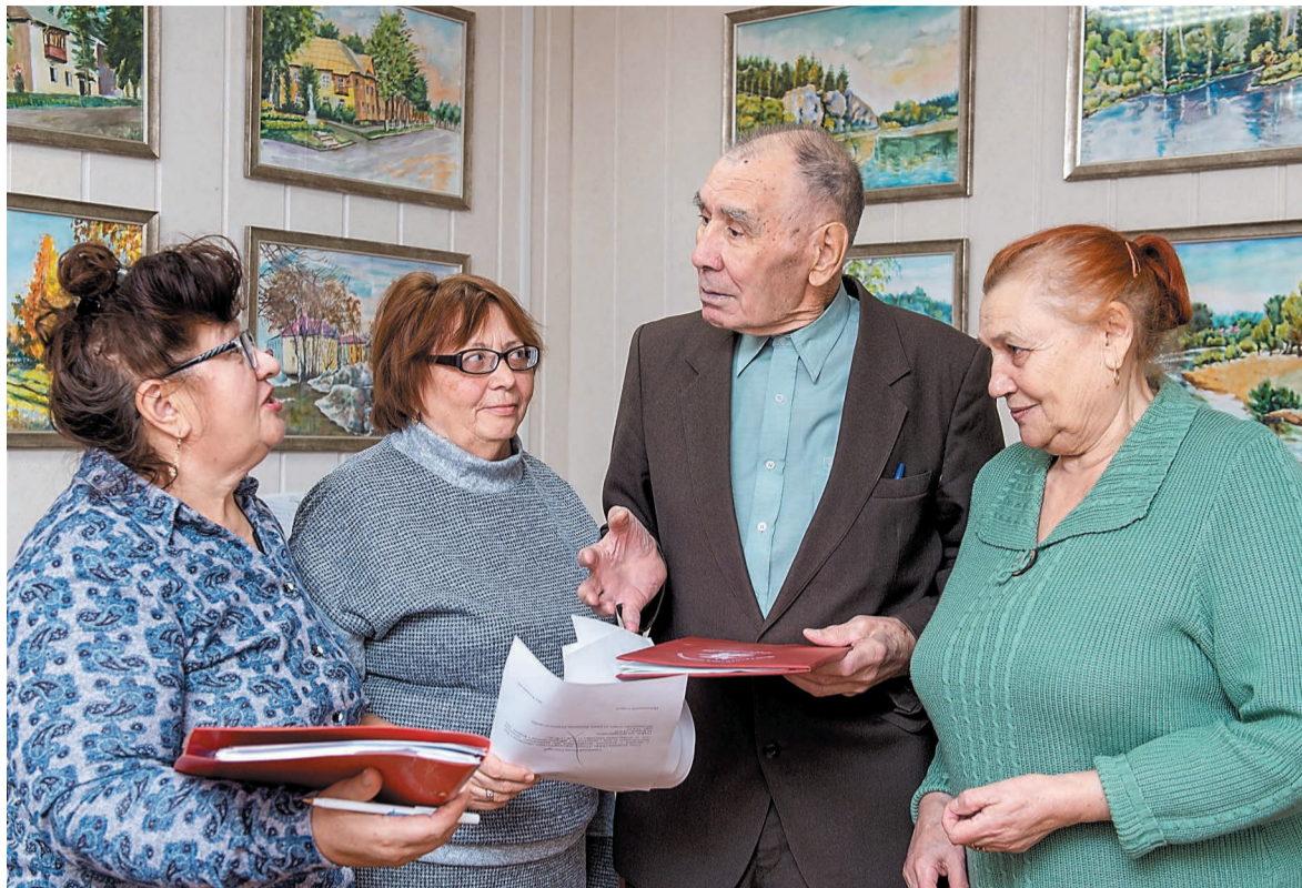
Традиционно работа совета была направлена на максимальное вовлечение ветеранов в активную жизнь, защиту социальных благ, сохранение истории нашего предприятия