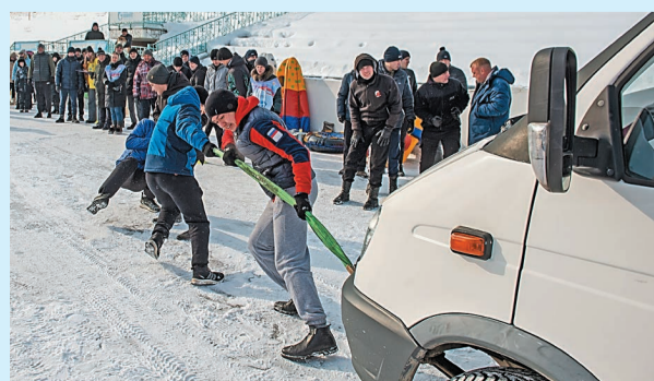
«Сила бригады – 2023»

Контакты: +7(917) 423-93-60, +7(917) 423-93-24, 8(3476) 35-23-59, e-mail: elen22907@rambler.ru.