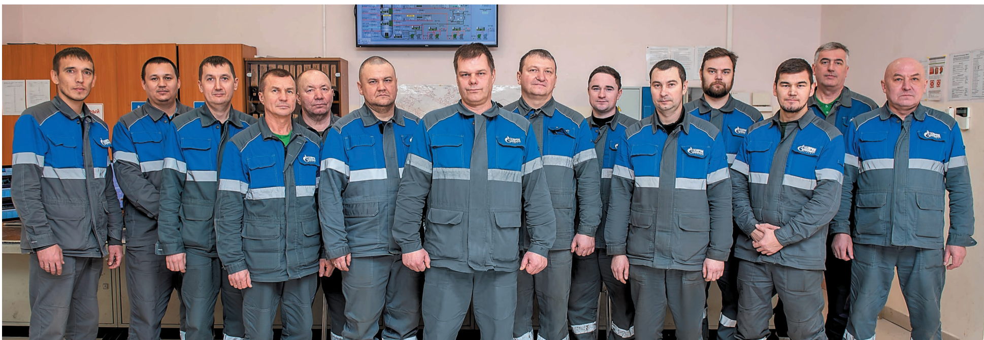
Технологический персонал установки ЭЛОУ АВТ-6