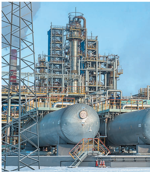
Установка ЭЛОУ АВТ-6