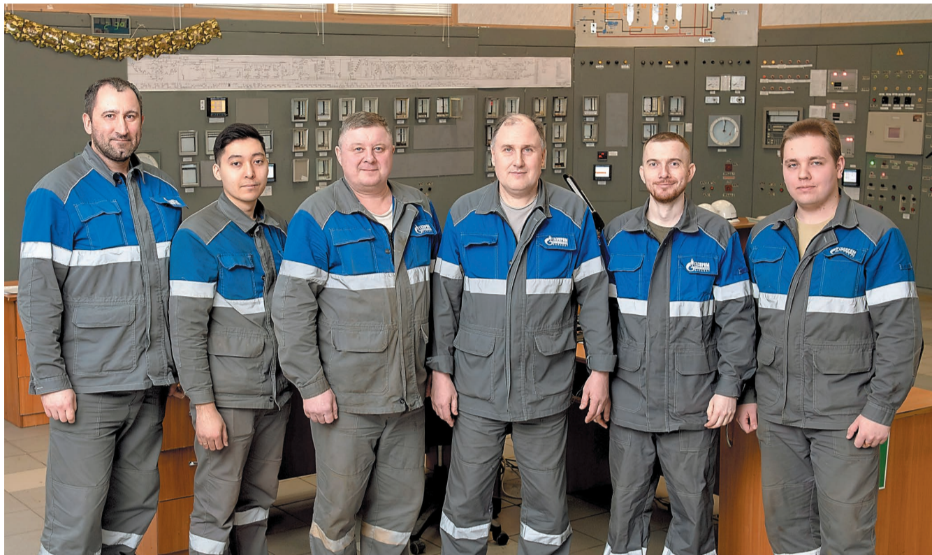
Установка гидрирования славится своими профессионалами

25 лет назад на комбинате было пущено производство 2-этилгексанола. Это вещество является одним из важнейших продуктов органического синтеза, необходимых для получения пластификаторов. Сложный и многоступенчатый процесс производства полезного продукта контролируют профессионалы своего дела. Нефтехимики из бригады № 2 установки гидрирования цеха № 34 рассказали о своих рабочих буднях.