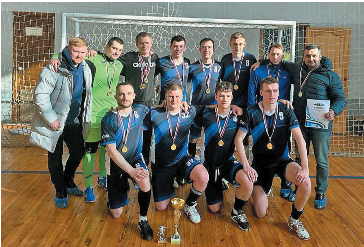
Футбольная команда «Мономер»

Футбольная команда «Мономер» победила в Открытом чемпионате Салавата по мини-футболу.