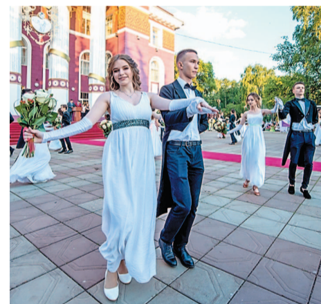
Фото из архива 2018 года

О том, что «Баллы бал» не может быть обычным мероприятием, в городе знают все. И в этом году будет масса сюрпризов. Подробности организаторы не раскрывают, но с уверенностью можно сказать: для отличников и хорошистов учебы подготовили все самое лучшее!