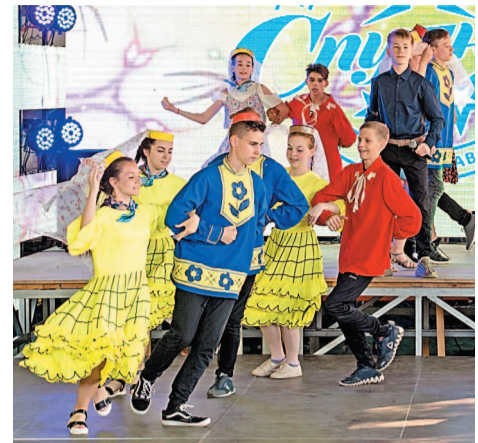
Летний вечер подарил всем отличное настроение