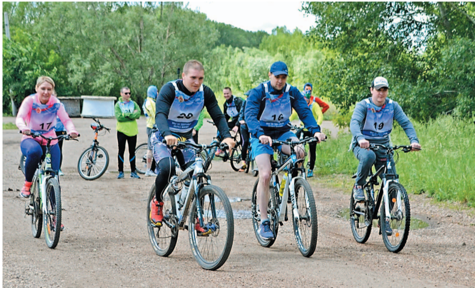
Дан старт велогонке на семикилометровую дистанцию