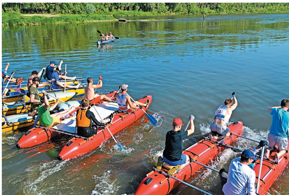
Вырвавшись вперед, команда «Управление-2» до самого финиша никому не отдала свое лидерство

На перекате, поймав течение реки, вперед вырвалась команда «Управление-2». Она до самого финиша сохранила лидерство и стала чемпионом захватывающей регаты. Спортсмены-любители «СНХП» не смогли поддержать ускорение соперников, сил хватило, чтобы на финише быть только вторыми.