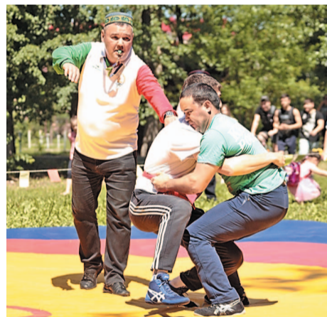
Праздничные моменты в парке