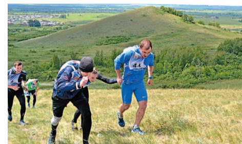
Рука об руку, плечом к плечу – все команды действовали сообща