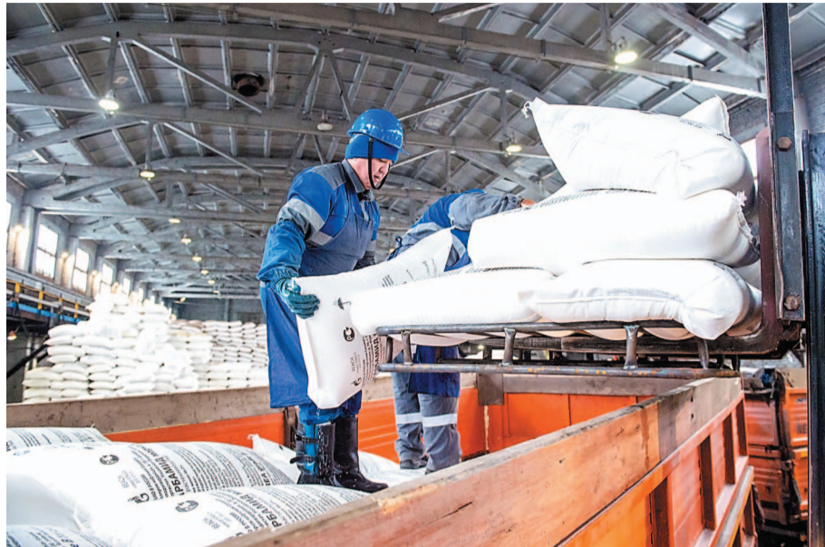
Карбамид марок А и Б производят в цехах № 24 и 50 газохимического завода. В 2019 году планируется получить 640,480 тысячи тонн прилированного и гранулированного карбамида

С начала года ООО «Газпром нефтехим Салават» отправило потребителям около 200 тысяч тонн минеральных удобрений.