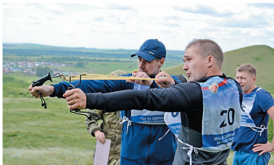
Проверка на меткость

Команда «Мономер» боролась до конца, если бы заводчане пришли к финишу вторыми, то по итогам всех этапов стали бы чемпионом проекта. Но регата не пошла, на финишной прямой мономеровцы пропустили вперед команды «ПВК» и «ПАТиМ», пришли пятыми на финиш, заняли третье место в общекомандном зачете.