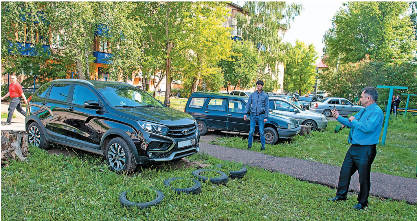
Нарушителей выявляет административная комиссия

Две месяца назад, 9 апреля, депутаты Госсовета Республики Башкортостан приняли изменения в республиканский Кодекс об административных правонарушениях, которые вводят штрафы для владельцев автомобилей за парковку на газонах, детских и спортивных площадках. Инициатива правильная, считает большинство салаватцев, однако и вопросов возникает немало.