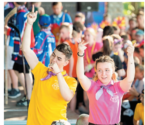
Более 2 тысяч детей отдохнут в «Спутнике» в этом летнем сезоне