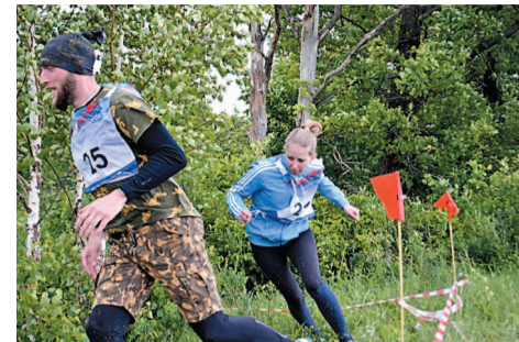
Представительницы слабого пола старались изо всех сил