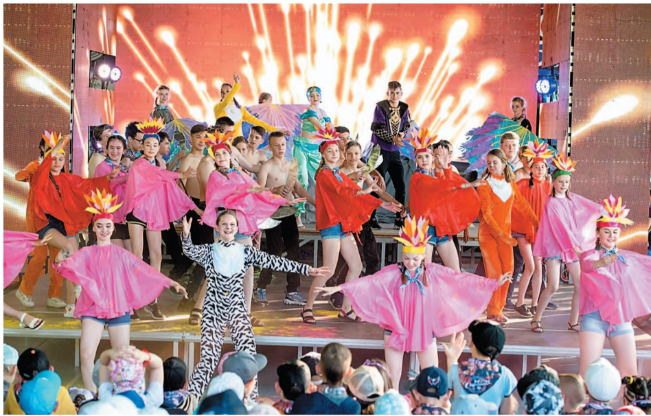
На открытие смены администрация «Спутника» украсила летнюю эстраду светодиодными декорациями, что создало атмосферу грандиозного праздника и фееричного шоу

– Всегда очень приятно приезжать в «Спутник». Рад, что и в этот раз смог попасть на открытие первой смены, даже на футбольном поле удалось символический гол забить. Надеюсь, что вы еще пригласите нас поиграть в рамках традиционного футбольного противостояния «Газпром нефтехим Салават» – «Спутник». Хотя до этого мы ни разу не проигрывали, что-то мне подсказывает, что в этом году спутниковцы будут сильнее – вы очень быстро