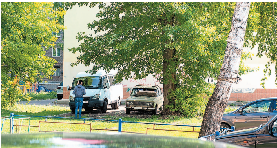
В одном из дворов Салавата

На сегодняшний день многие жители изъявляют желание обустроить парковки во дворах, обращаясь к нам, мы предлагаем участие в программе благоустройства, даем разъяснения при непосредственном обращении и отвечаем на вопросы в социальных сетях.