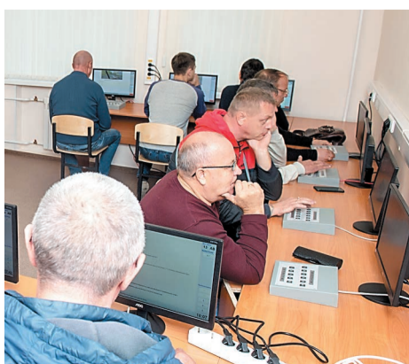
Проходит пробное тестирование водителей ПАТИМ на знание ПДД

Одновременно в автошколе смогут заниматься три группы по 30 курсантов. Параллельно с этим потоком будут проверяться знания у водителей ООО «ПАТИМ». Для начала учебного процесса автошколе осталось пройти проверку на соответствие материально-технической базы предъявляемым требованиям программ подготовки водителей, по результатам которой будет выдана лицензия. Ориентировочный срок получения лицензии – 45 дней.