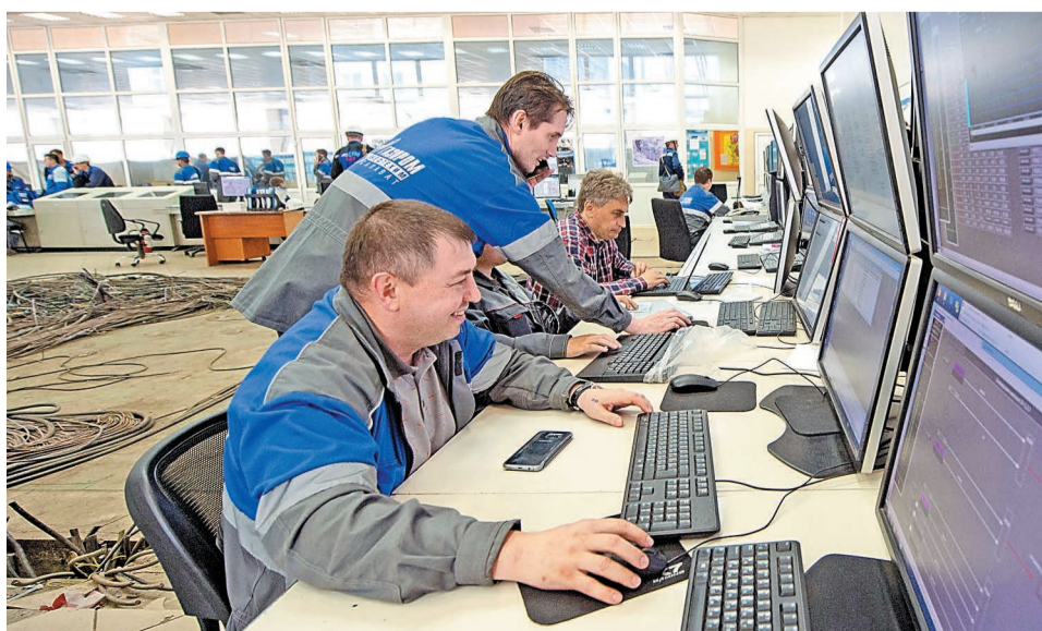
Модернизация системы АСУТП стала одной из важнейших задач капремонта на ЭП-355

Вторая волна ремонтов прошла на производствах этилена, пропилена и полимеров. В рамках ремонта реализован ряд серьезных мероприятий. На установках пиролиз-1 и пиролиз-2 цеха № 55 выполнена модернизация системы АСУТП. В цехе № 56 – замена факельного оголовка. Глобальных программ по увеличению мощности не было предусмотрено. Главная задача – устранить дефектные участки и уверенно выйти на двухгодичный межремонтный пробег, до 2021 года.