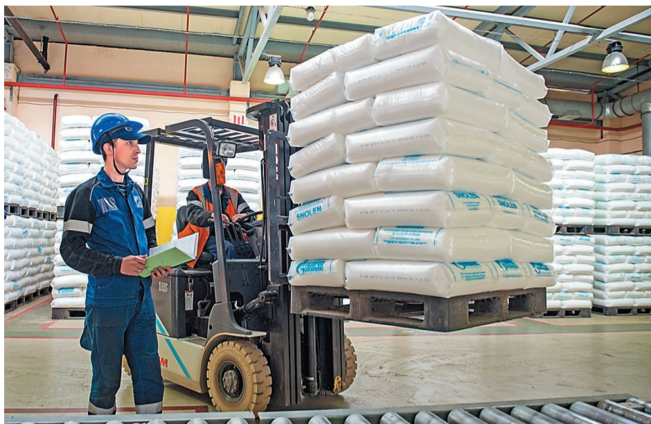
Полиэтилен суспензионный высокой плотности – один из наиболее востребованных видов продукции ООО «Газпром нефтехим Салават»