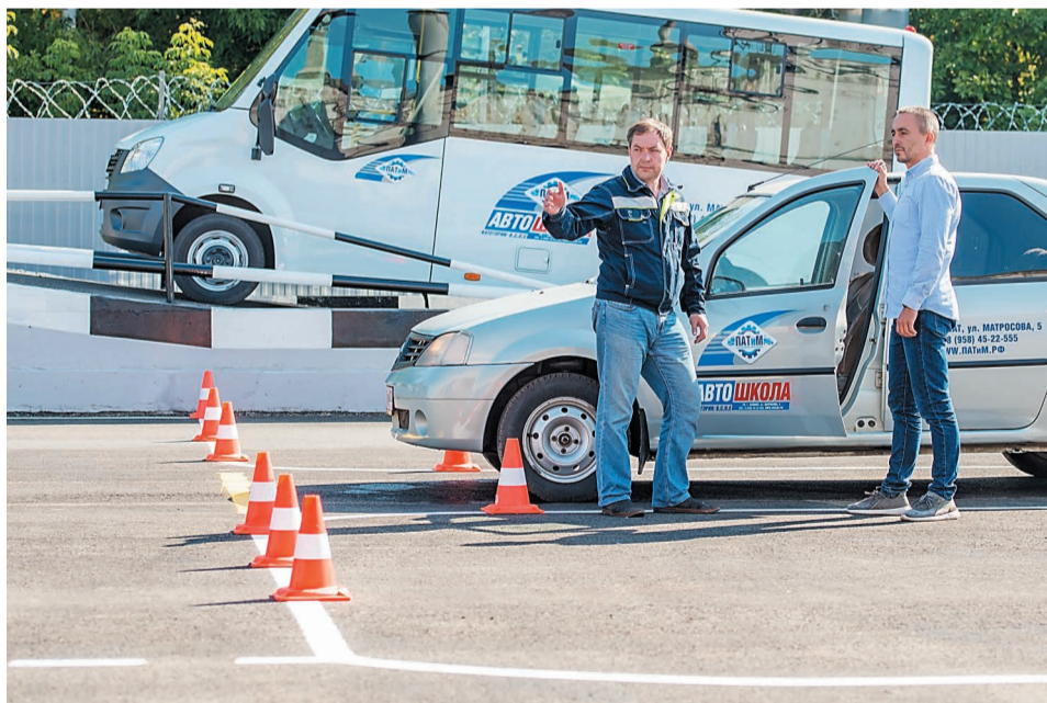
Автодром новой автошколы расположен на территории ПАТИМ

Предприятие автомобильного транспорта и механизмов (ПАТИМ) подготовило классы для занятий и сдачи экзаменов, а также учебный полигон для обучения вождению действующих и начинающих водителей на категории А, В, С, D, Е.