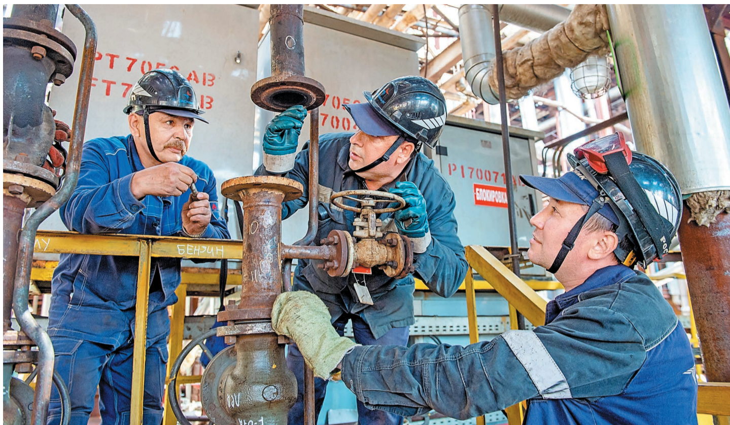
Установка арматуры на трубопроводе сырья после ревизии