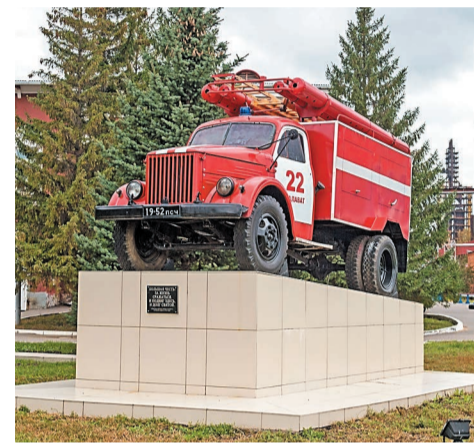
Памятник в честь основания пожарной охраны в Салавате установлен на территории ПСЧ-22

Сегодня на страже пожарной безопасности компании «Газпром нефтехим Салават» стоит пожарно-спасательная часть, в составе которой более 300 человек. На вооружении находится 31 единица современной и хорошо оснащенной пожарной техники, 85 радиостанций, 16 комплектов гидравлического аварийно-спасательного инструмента. Ежедневно на боевом дежурстве находится 50 человек и 15 единиц пожарной техники. Пожарные постоянно совершенствуют свои профессиональные и тактические навыки в ежедневных тренировках.