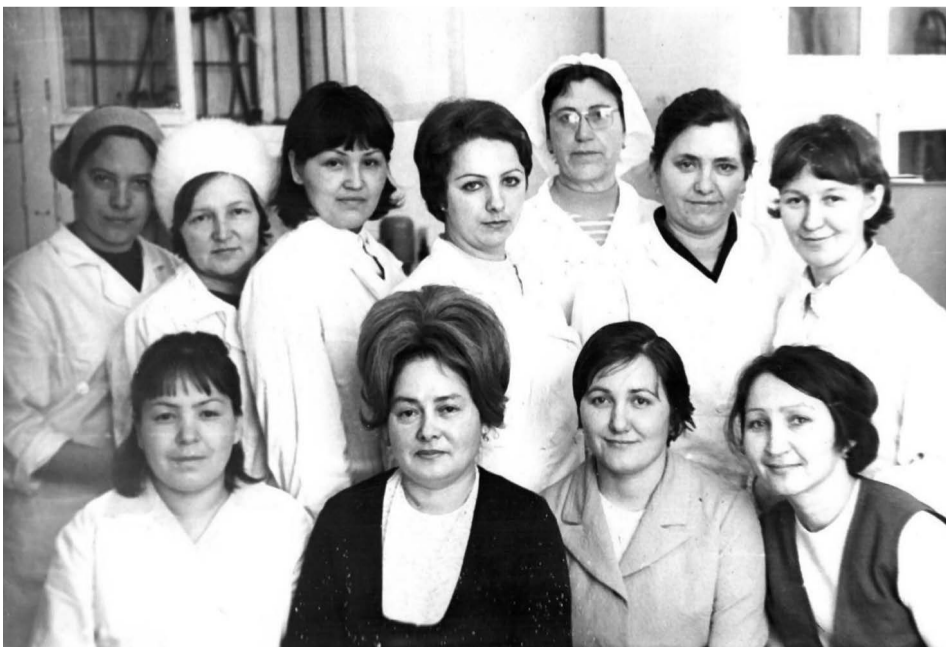
Коллектив отдела нефтехимических производств

Коллектив опытно-исследовательского цеха принимал участие в освоении практически всех производств комбината. Наука шла рука об руку с производством.