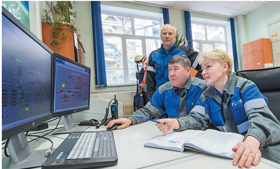
В операторной ПЭС смонтировали систему АСУТП для новых горелок котлов-утилизаторов

Особенность и сложность технического перевооружения установки ПЭС в том, что работы производятся поблочно, без остановки производства в целом.