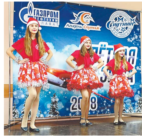
На «Голубом огоньке» активно выступали как вожатые, так и дети

Впервые Новый год дети встретили за празднично украшенными столами в стиле программы «Голубой огонёк». Отступая от сложившихся традиций, компания «Агидель-Спутник» совместно с ООО «Промпит» устроила поздний ужин.