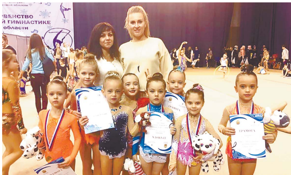
Шесть салаватских гимнасток стали победительницами всероссийского турнира

Почетной гостьей турнира стала олимпийская чемпионка 2016 года Маргарита Мамун, которая не только провела награждение, но и дала советы подрастающему поколению на мастер-классе.