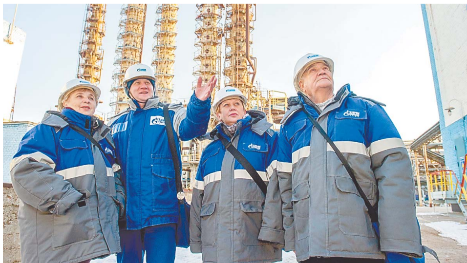
Ветеранам рассказали о буднях производства

Действительно, коллектив многое пережил. После вывода мощности старых бутиловых спиртов (цех № 21) и закрытия производства СЖС цеха № 21 и № 34 в 1993 году объединились. Но в 1994 году цех № 34 закрыли из-за отсутствия сырья. Производство решено было реконструировать и перевести на выпуск новых видов продукции. Реконструкция была завершена в 1997 году, но и после этого цех стоял законсервированным. Был глубокий экономический кризис. Лишь в 1999 году производство запустили на получение 2-этилгексанола!