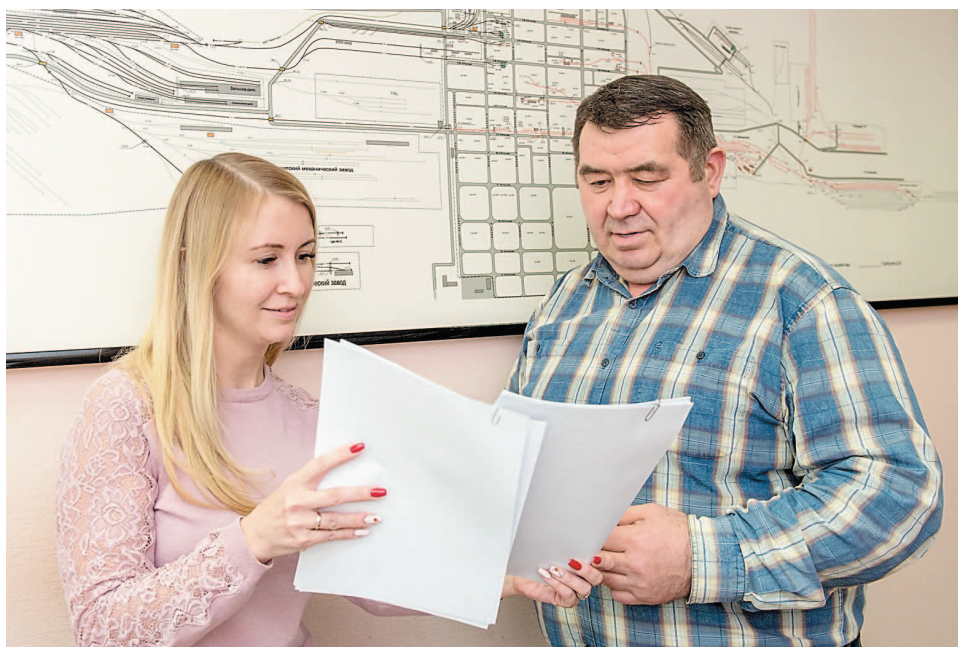
Специалисты сектора перевозок в ответе за бесперебойные отгрузки продукции