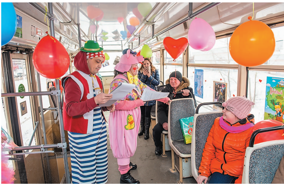
Прокатиться на трамвае в «театральный» час – одно удовольствие!

14 февраля с 14 до 15 часов по городу курсировал трамвай, где выступали артисты Салаватского башкирского драматического театра.