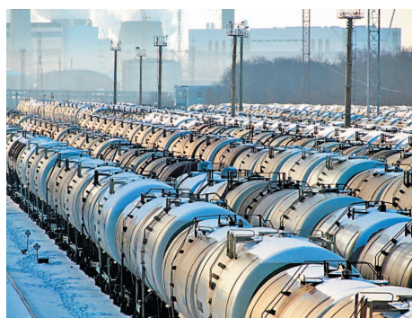
Вагонные составы на железнодорожной станции Аллагуват

Латвии и других, откуда потом он и отправится потребителю.