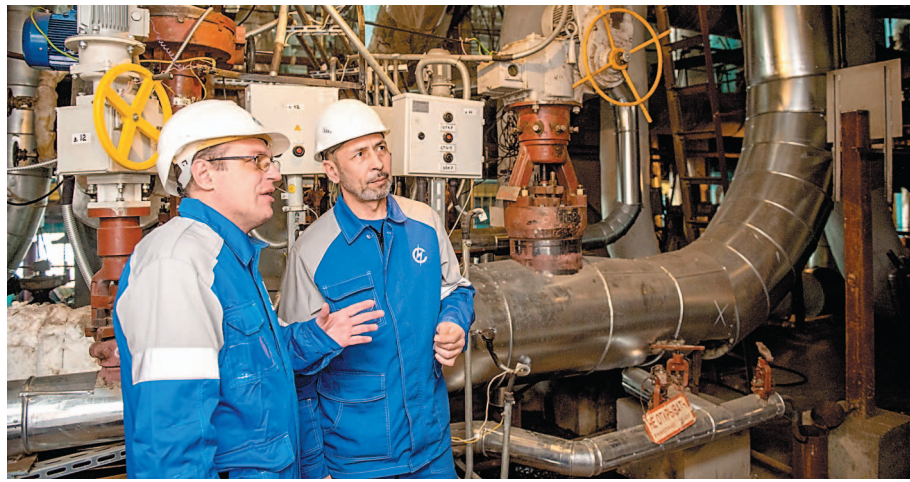
Быстродействующая редукционно-охладительная установка резервирует пар для новых и действующих производств