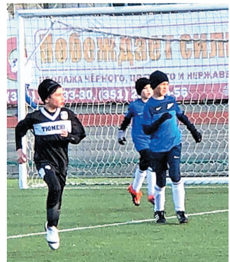
Зенитовцы хорошо отработали игровые моменты