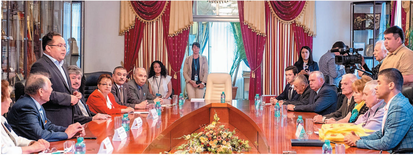
Встреча прошла с целью – поделиться опытом работы и определить новые направления в работе