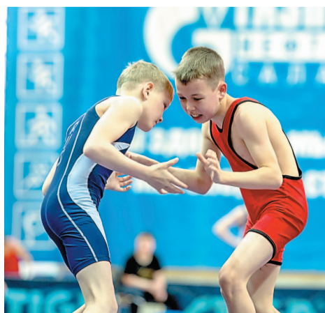
В греко-римской борьбе не бывает ничьей. Побеждает самый выносливый и стойкий