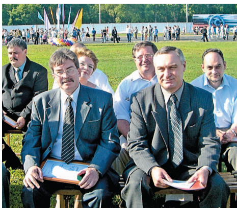
В 2007 году на День химика лучшие работники компании впервые были награждены Золотым, Серебряными и Бронзовыми знаками

Люди, профессионалы своего дела – главное богатство компании. На промышленной площадке трудятся тысячи специалистов своего дела: машинисты, аппаратчики, операторы, инженеры, лаборанты, технологи, электрики, механики, метрологи, прибористы и представители многих других профессий. Они продолжают традиции достижений ветеранов комбината, благодаря которым предприятие стало одним из крупнейших нефтехимических комплексов в стране. Все вместе делают общее дело. И с гордостью носят звание – нефтехимики!