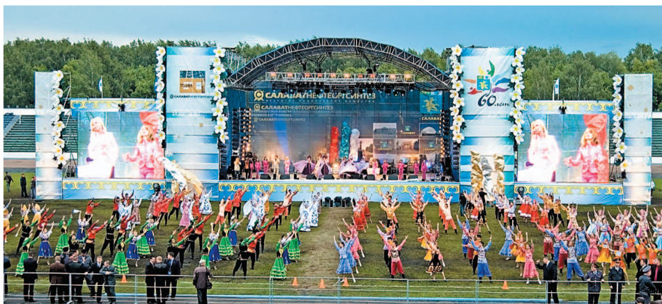
В 2008 году, когда компания отмечала свое 60-летие, в День химика на стадионе города прошел большой праздник