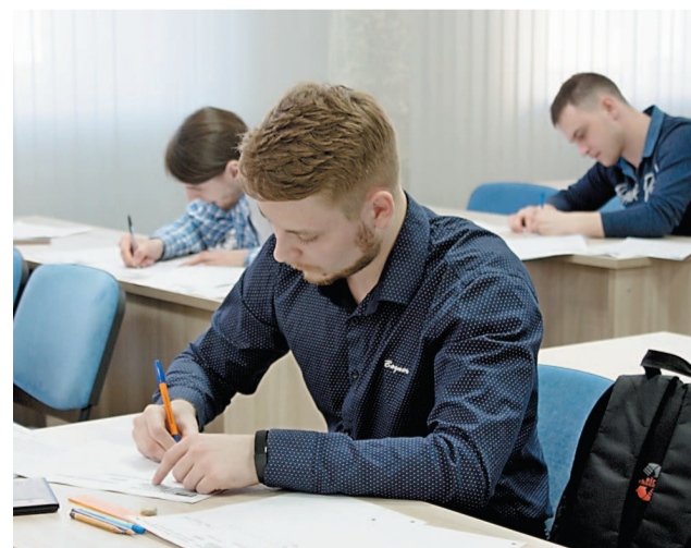
Олимпиада «Газпром» в этом году проходила впервые