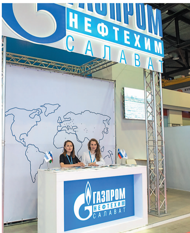
Стенд ООО «Газпром нефтехим Салават»

На торжественном открытии выставки временно исполняющий обязанности Главы Республики Башкортостан Радий Хабиров отметил, что «в очередной раз Уфа стала центром притяжения представителей самой влиятельной, сильной отрасли России. Интересен тот факт, что 27-й раз мы проводим форум, и целое