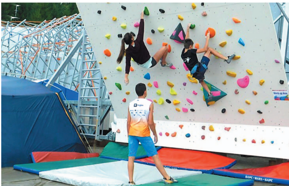
Тренировки перед соревнованиями