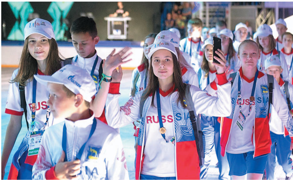
Участники соревнований на открытии Игр