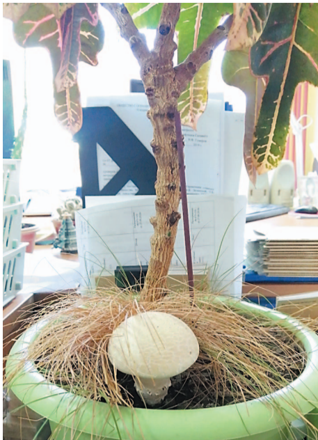
Замечательный ароматный шампиньон с большой шляпкой диаметром в 6-7 см