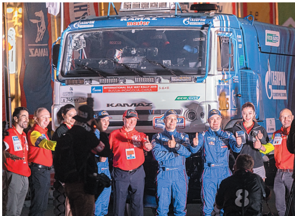
Команда газового КАМАЗа

На территории России заправку транспорта природным газом сегодня обеспечивают более 300 газозаправочных