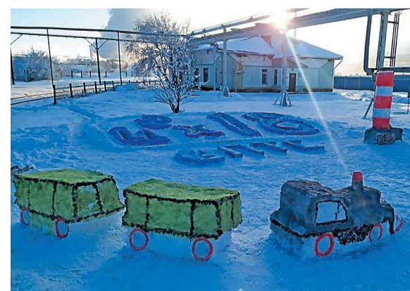
Снежные фигуры в исполнении сотрудников производства технической серы