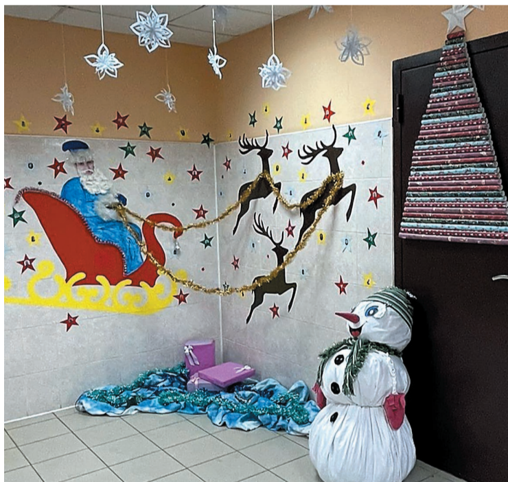
Оригинальное украшение рабочего помещения от цеха № 56 завода «Мономер»