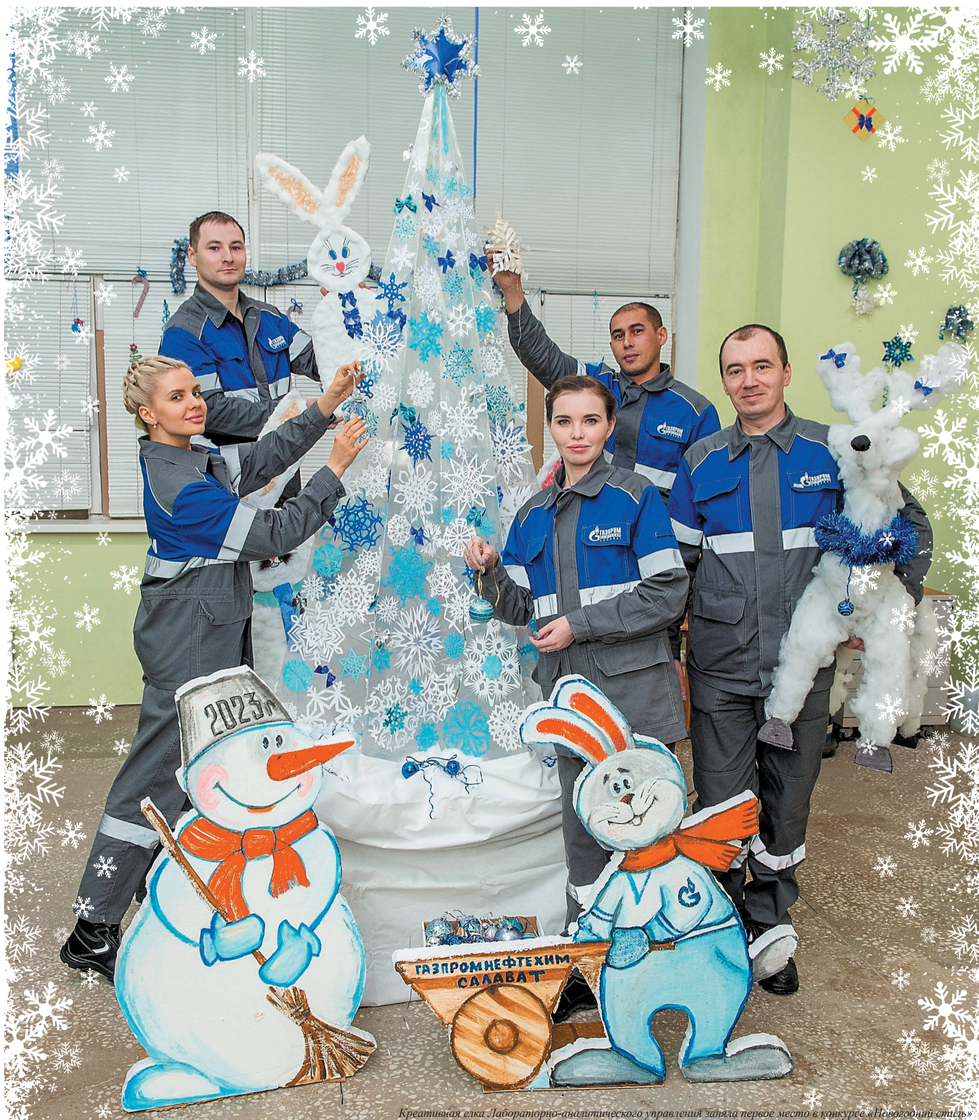
Креативная елка Лабораторно-аналитического управления заняла первое место в конкурсе «Новогодний стиль»