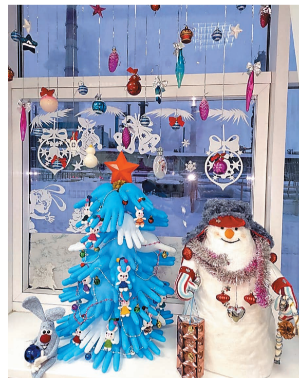
Лесная красавица украшает цех №11, УОВ-595 нефтеперерабатывающего завода

– Наступает год Черного Водяного Кролика. Мы сделали зверьку теплый семейный очаг. На работе проводим большую часть нашей жизни, поэтому в коллективе поддерживаем дружеские отношения. В ходе работы над композицией каждый внес свой вклад в создание домашнего очага, и итогом стала замечательная теплая история, – говорят о своей работе лаборанты.