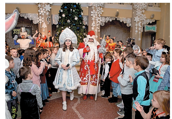
Атмосфера доброй сказки создала новогоднее настроение

В фойе около красавицы-елки в маскарадных костюмах собрались дети разных возрастов. Театр пантомимы «Пигмалион» и хореографические коллективы «Весна», «Родничок», «Улыбка» подготовили для них интересное праздничное представление. В гости к детям пришли Дед Мороз, Снегурочка, Маг, Баба Яга и другие сказочные персонажи.