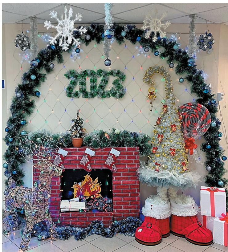
Новогоднее вдохновение в стенах Управления главного технолога