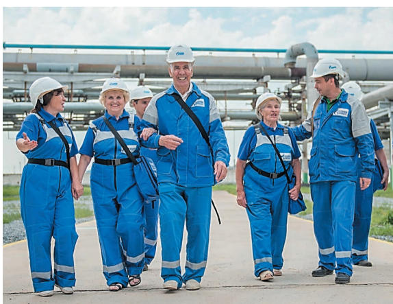
На экскурсии в цехе № 24