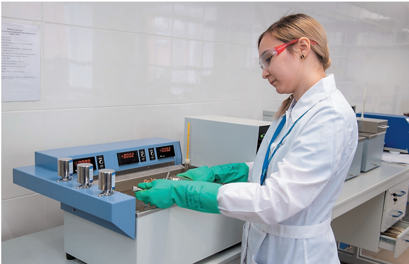
В обновленной лаборатории уже сегодня применяются новые методы испытания нефтепродуктов