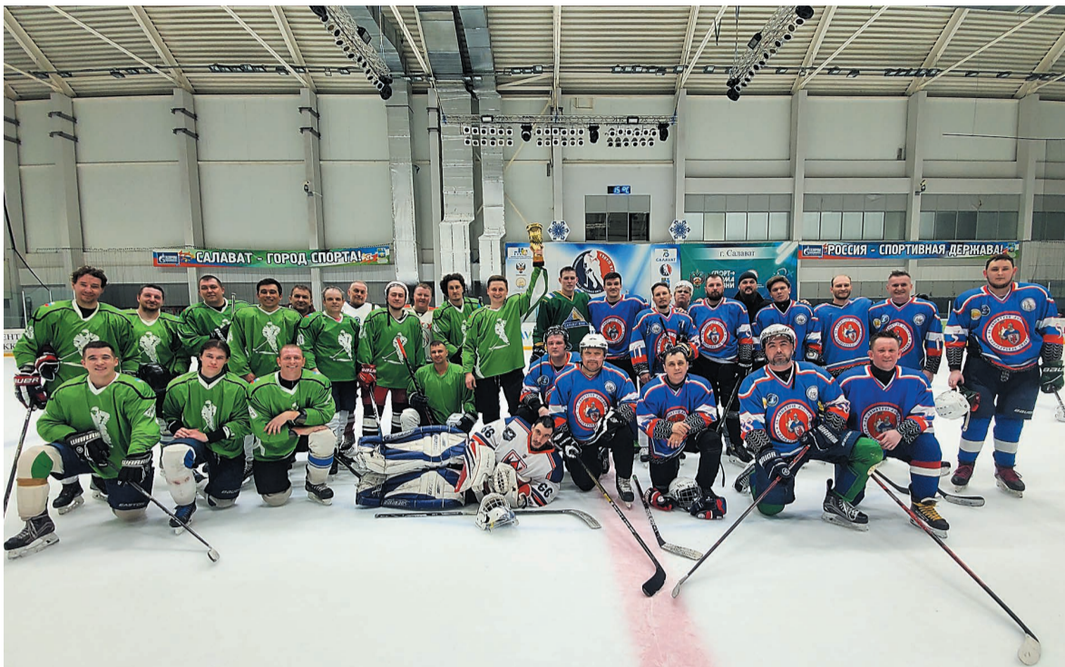
Финалисты турнира: команда «КапСтрой» и «Дмитрий Донской».

Хоккеисты нашего города уже второй год подряд выходят на лед, чтобы побороться за кубок Салавата по этому виду спорта. Среди участников соревнований немало сотрудников компании «Газпром нефтехим Салават», а первое место в этом году заняла команда «КапСтрой», представляющая Управление капитального строительства.