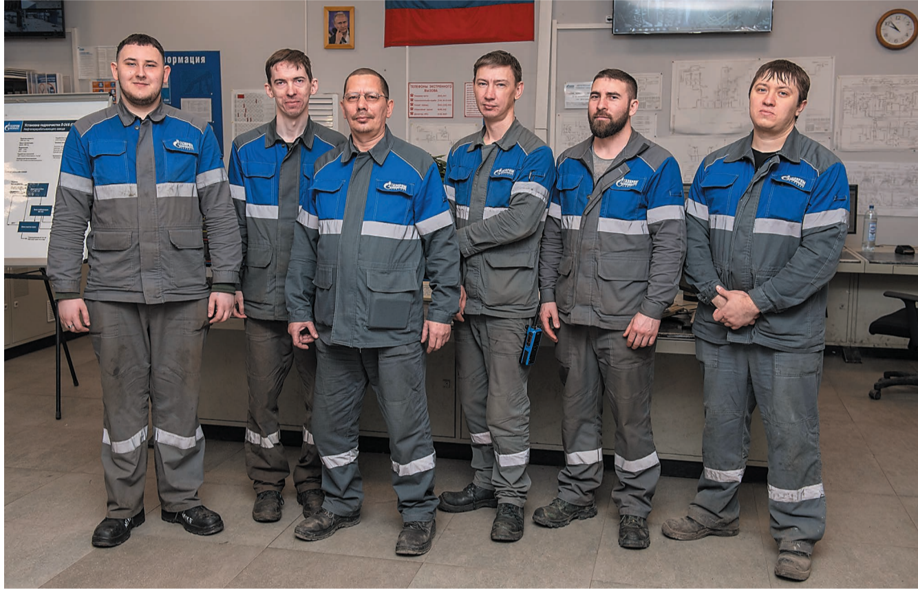
На смене – бригада № 3 установки ГО-2

Уже более полувека установка ГО-2 нефтеперерабатывающего завода сохраняет статус одной из важнейших в Обществе, являясь его основной дизельной мощностью. Сегодняшний коллектив установки старается держать марку и относится к своим профессиональным обязанностям с интересом и самоотдачей.