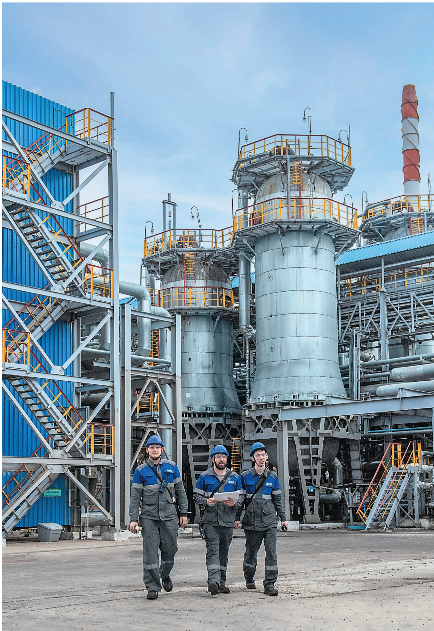
На установке ГО-2

В 1969 ГОДУ НА ПРЕДПРИЯТИИ БЫЛА ВВЕДЕНА В ЭКСПЛУАТАЦИЮ УСТАНОВКА ГИДРООЧИСТКИ ГО-2, КОТОРАЯ И СЕГОДНЯ ОСТАЕТСЯ ОДНОЙ ИЗ КЛЮЧЕВЫХ НА НЕФТЕПЕРЕРАБАТЫВАЮЩЕМ ЗАВОДЕ.