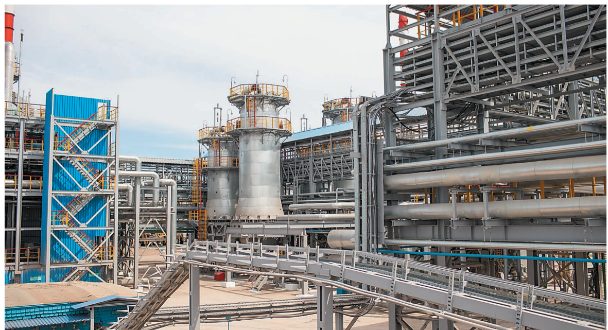
Реакторы первой нитки установки ГО-2