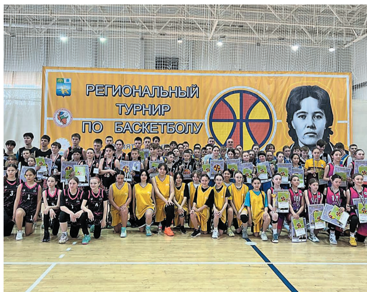
Участники соревнований.