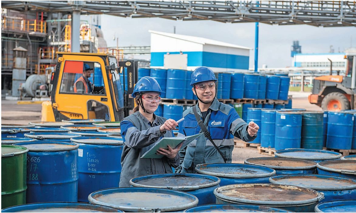
На ГО-3 доставили новый катализатор отечественного производства

На нефтеперерабатывающем заводе компании начались плановые капитальные ремонты. Первыми по графику на ремонт остановились установки КК-2 и ГФУ-1 цеха № 4, а также ГО-3 цеха № 9.