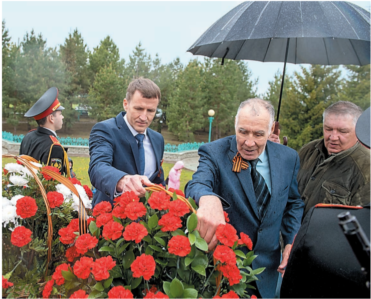
Возложение цветов на мемориальном комплексе «Земля Юрматы»