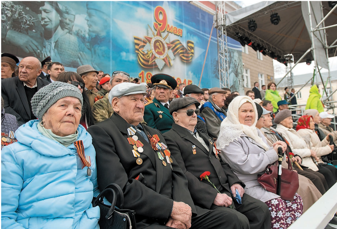
Трибуна с ветеранами Великой Отечественной войны и почетными гостями праздника

9 мая жители города чествовали ветеранов Великой Отечественной, вспоминали героев, павших на полях сражений, а также людей, ковавших победу в тылу.