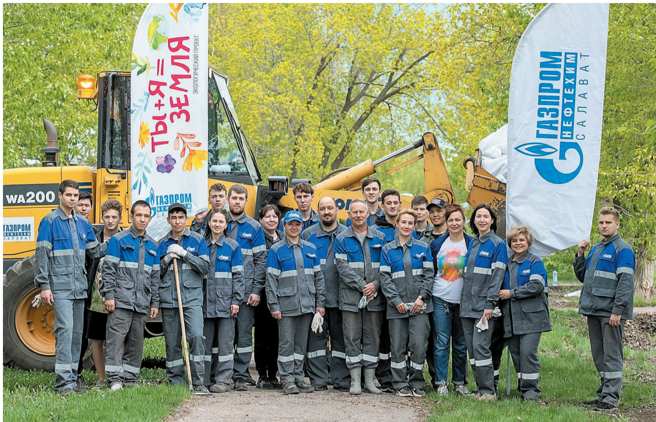
Сотрудники компании на общегородском экологическом субботнике в Салавате

55 000 квадратных метров городских улиц очистили от мусора и прошлогодней листвы сотрудники ООО «Газпром нефтехим Салават». Они присоединились к общереспубликанской экологической акции «Зеленая Башкирия».