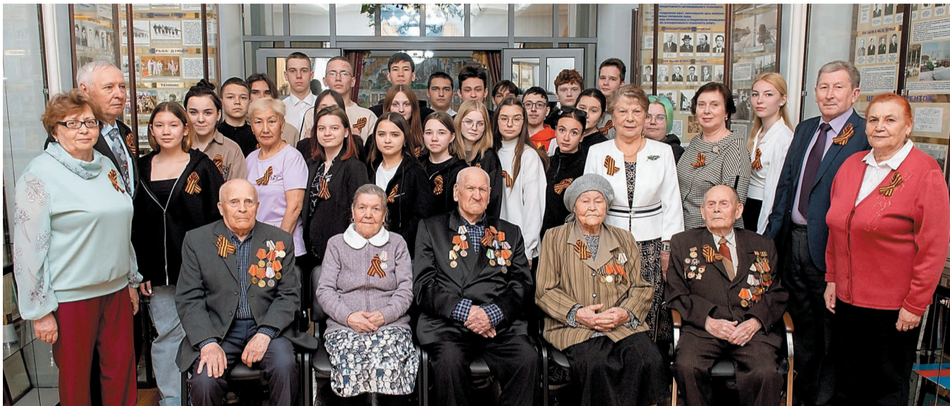
Участники встречи в музее трудовой славы ООО «Газпром нефтехим Салават»