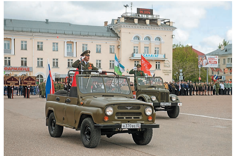
Парад Победы на площади им. Ленина в г. Салавате

После завершения митинга праздничная автомобильная колонна с гостями проследовала на площадь им. Ленина, где в ожидании парада собрались жители города. Ветеранов люди встречали аплодисментами, организаторы подготовили им места на специальной трибуне. В параде Победы традиционно приняли участие ветераны войн в Афганистане и Чечне, сотрудники учреждений Федеральной системы исполнения наказаний, кадеты, студенты, школьники, участники общественных движений, а в этом году строем прошли еще и резервисты. Безусловно, одним из любимых действий парада является проезд театрализованной автоколонны, где