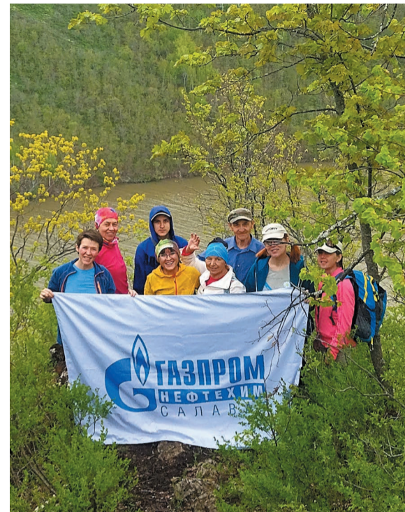
Участники экологической акции в национальном парке «Башкирия»

Работники компании приняли участие в подготовке к сезону экологической тропы «Бейек-Тау» в национальном парке «Башкирия».