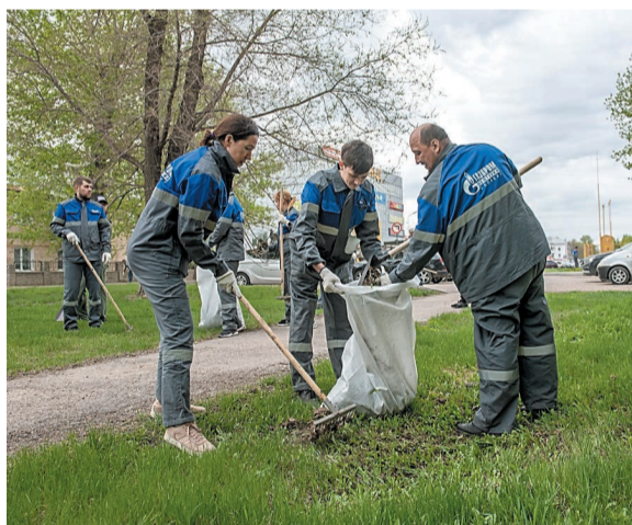
Ул. Уфимская. Уборка прошлогодней листвы

– Бываю на субботниках почти каждый год, так как работаю уже 32 года. В процессе уборки общаешься с людьми, знакомишься. На следующий год видишь уже знакомые лица. Заметил, молодежь стала намного больше принимать участие в субботниках. Мы передаем им свой опыт. Здорово же!