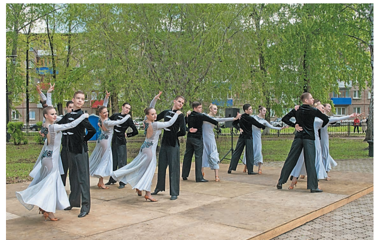
Праздничная программа в сквере ДК «Нефтехимик»