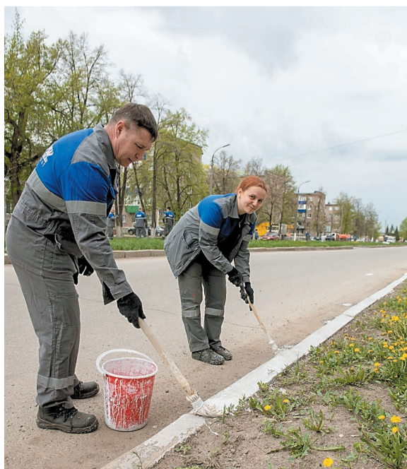
Ул. Октябрьская. Побелка бордюров