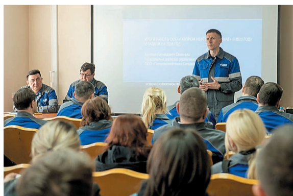
Встреча с коллективом нефтеперерабатывающего завода