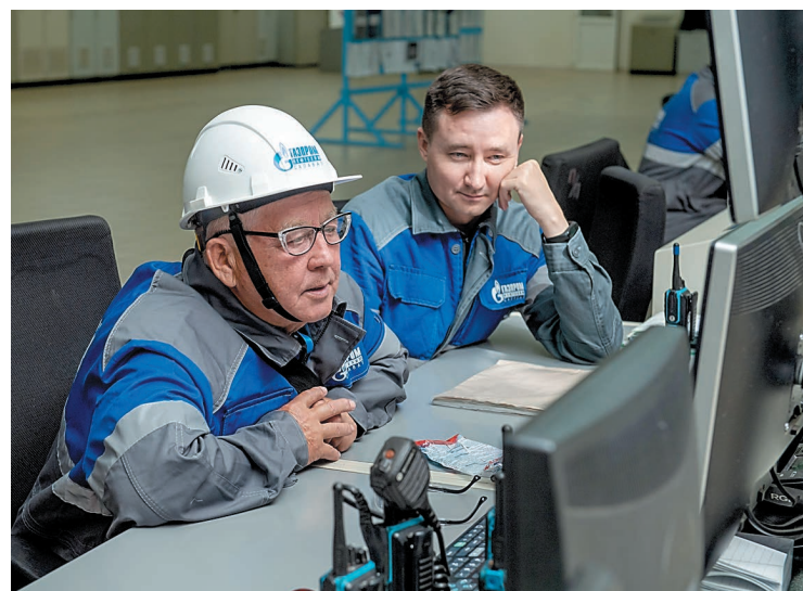
Ветераны активно интересовались новшествами технологического процесса