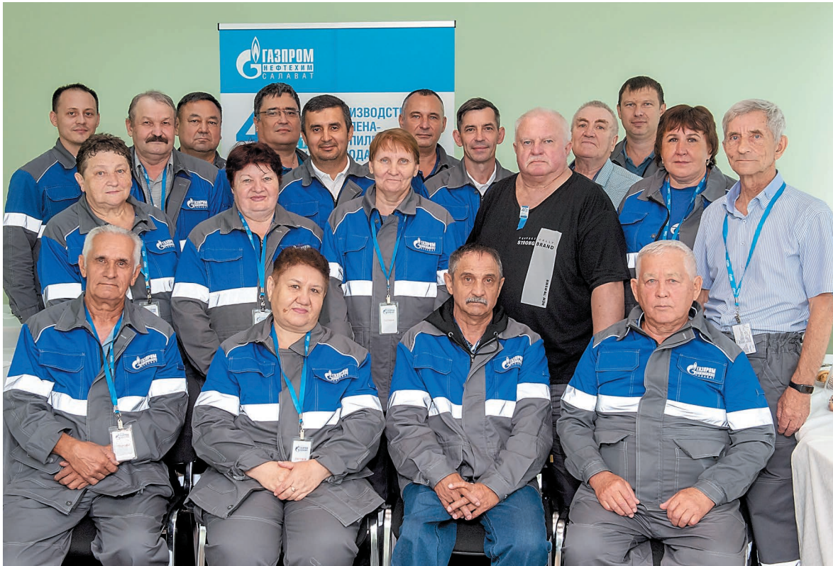
Вернуться в родной цех, увидеться с коллегами – такую возможность ветеранам предоставило руководство завода «Мономер» и ЭП-355

В преддверии 40-летнего юбилея производства этилена и пропилена руководство завода «Мономер» пригласило бывших работников подразделения на экскурсию по цехам, где они когда-то трудились. Встреча была наполнена теплыми объятиями, воспоминаниями и даже слезами радости.