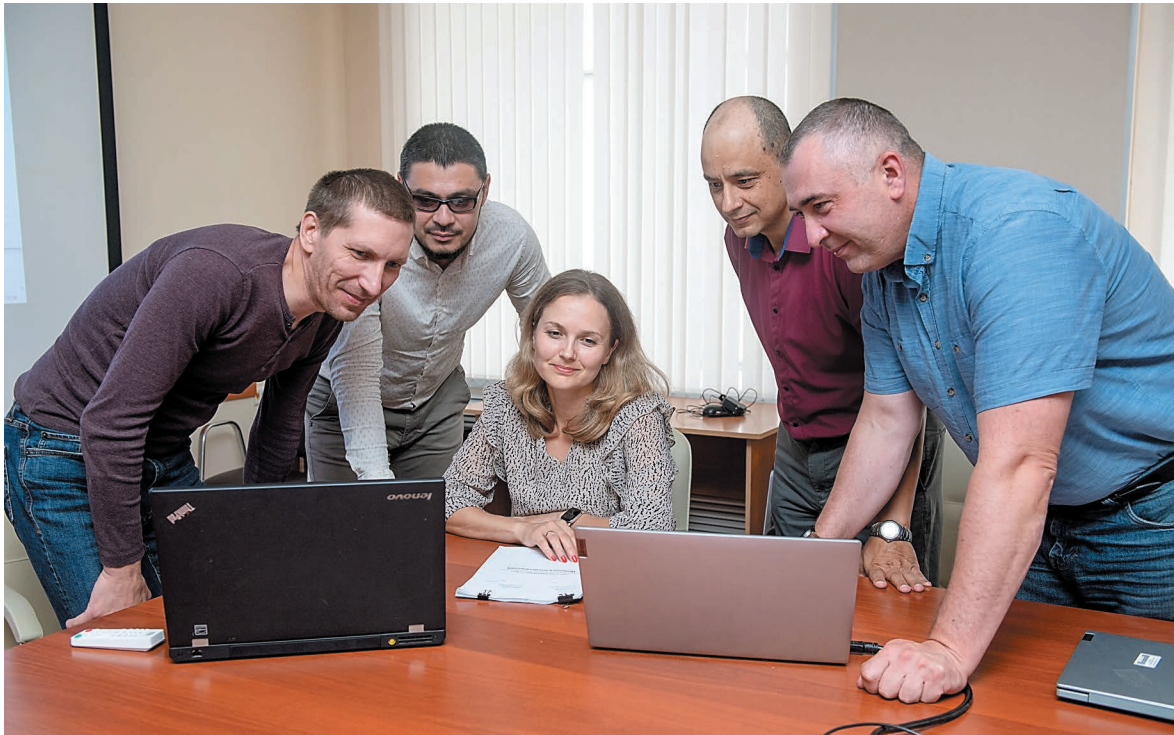
Оперативное совещание в Управлении информационных технологий и связи по вопросам внедрения отечественного ПО

Цифровая трансформация, которая является одной из национальных целей развития России до 2030 года, неразрывно связана с другим реализуемым в стране масштабным проектом – импортозамещением в сфере информационно-коммуникационных технологий. В компании «Газпром нефтехим Салават» планомерно ведется работа по переходу на отечественное программное обеспечение.