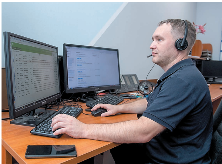
Ежедневный труд отдела внедрения информационных систем

В Обществе с 2019 года ведется целенаправленная работа по импортозамещению, за это время сотрудниками УИТ и С была проведена большая работа с бизнес-подразделениями, разработчиками ПО и интеграторами. В результате сформирован целевой образ рабочего места сотрудника, включающего в себя операционную систему РЕД ОС, офисный пакет Р7-Офис, корпоративный портал Р7 и другие аналоги импортного ПО. Ведется работа по включению в образ почтовой системы VK WorkMail, мессенджера VK Teams. Каждое ПО проходит тестирование на предмет совместимости с корпоративными процессами и поддержки необходимого функционала. Большинство проектов находятся в активной фазе внедрения. Например, сейчас ведутся работы по установке ПО «Р7-Офис. Десктоп», и в ближайшее время каждое рабочее место будет оснащено указанным