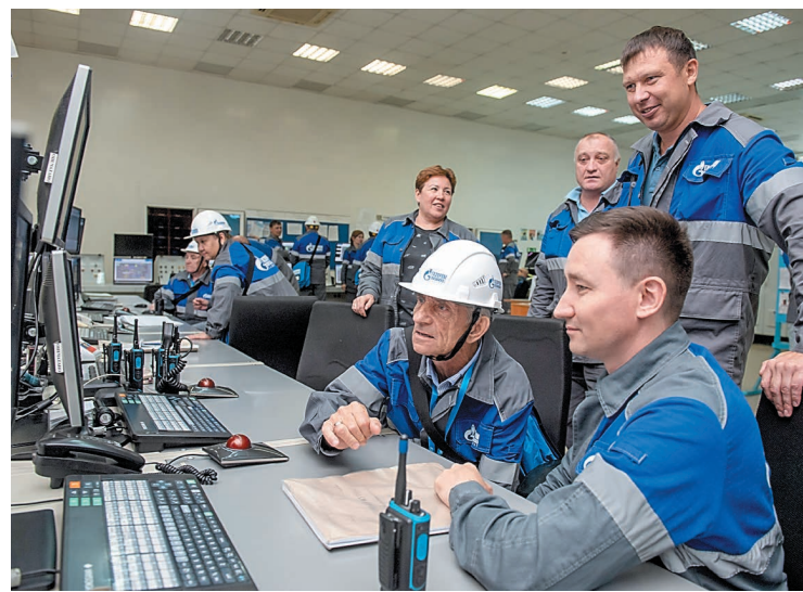
Многие из ветеранов проработали на производстве с момента пуска