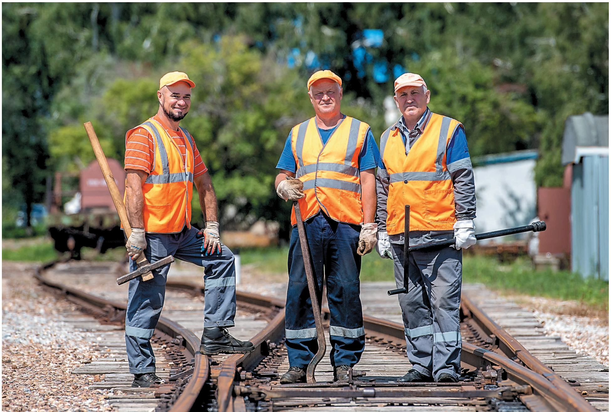
Монтеры пути ООО «Предприятие промышленного железнодорожного транспорта»

В ПЕРВОЕ ВОСКРЕСЕНЬЕ АВГУСТА В РОССИИ ОТМЕЧАЕТСЯ ДЕНЬ ЖЕЛЕЗНОДОРОЖНИКА. НАКАНУНЕ ПРОФЕССИОНАЛЬНОГО ПРАЗДНИКА РАССКАЗЫВАЕМ О ТРУДОВЫХ БУДНЯХ РАБОТНИКОВ ООО «ПРЕДПРИЯТИЕ ПРОМЫШЛЕННОГО ЖЕЛЕЗНОДОРОЖНОГО ТРАНСПОРТА»