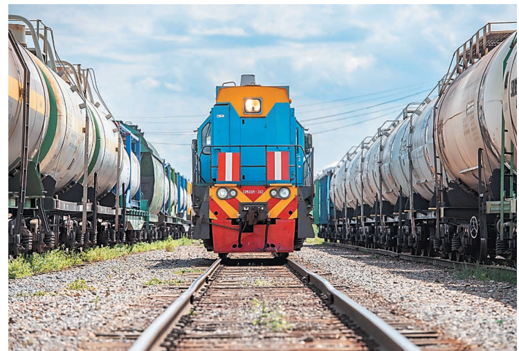
На станции «Южная»