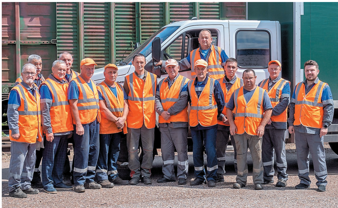
Коллектив участка путевого хозяйства на станции «Южная»

Железнодорожная станция «Салават» организует перевозку одной из самых больших по всей Куйбышевской железной дороге номенклатур грузов, основной объем которых принадлежит ООО «Газпром нефтехим Салават». Подачей вагонов для слива и выгрузки сырья, а также для отгрузки готовой продукции Общества без малого 75 лет занимается ООО «Предприятие промышленного железнодорожного транспорта».