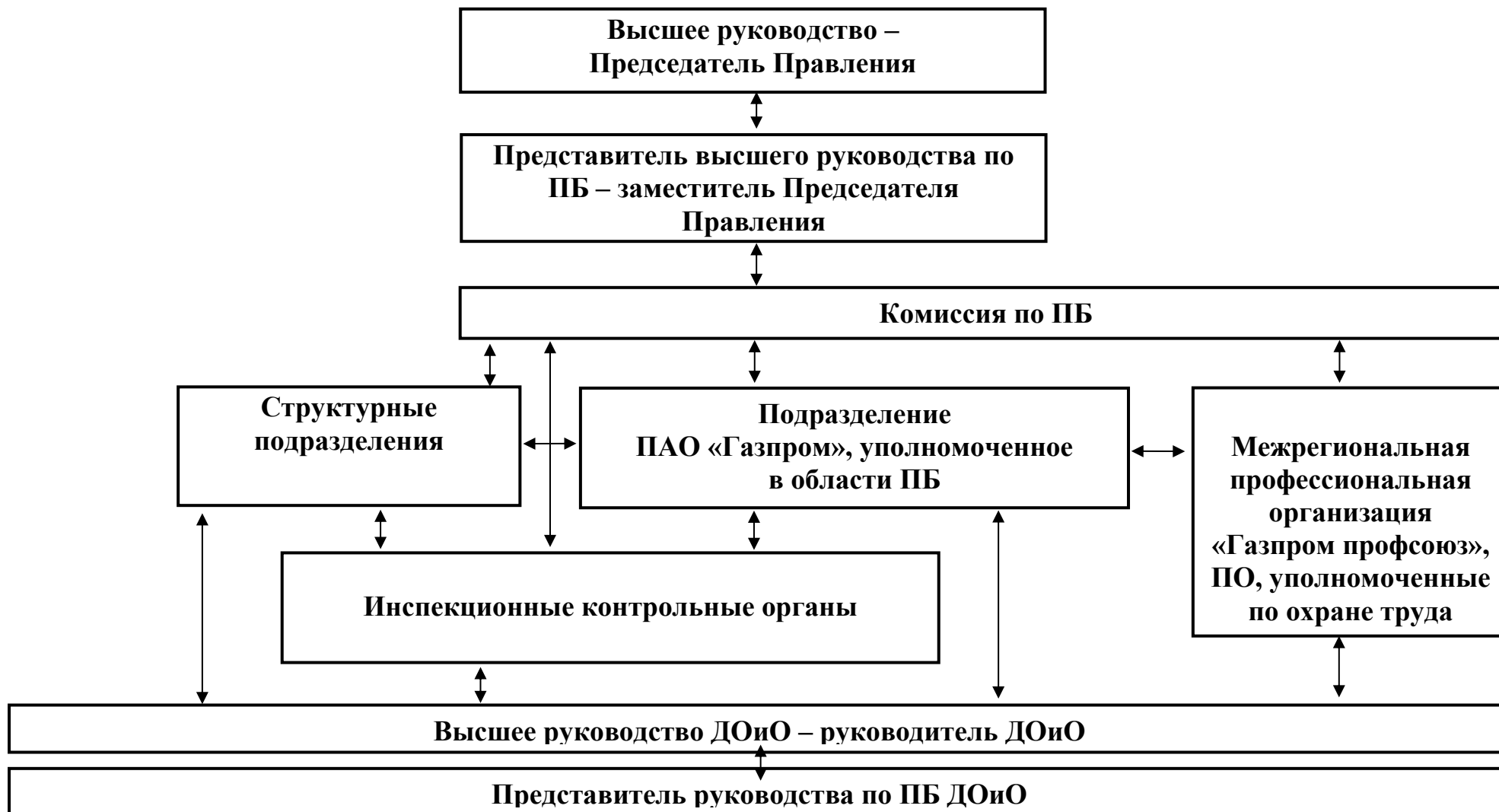
Схема структуры Единой системы управления производственной безопасностью в ПАО «Газпром»